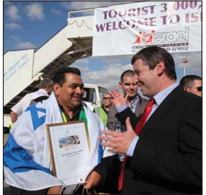
הכומר האוונגלי ריבמר ארג'ו לדיס, שהגיע לארץ מברזיל בראש מישלחת של 120 צליינים, הוכתר בתואר התייר השלושה מיליון ואחד, ובכך שבר את השיא בתיירות ניכנסת שניקבע בשנת 2008. שר התיירות ומנכ"ל המשרד קיבלו את פניו בדרתו מן המטוס.

הנהלת איגוד מנהלי בתי מלון בישראל על שם ינוש דמון, החליטה להנציח את זכרו של ינוש דמון גם בקריאת האיגוד על שמו וגם באמצעות מילגת השתלמות שתוענק מדי שנה לעובד מלון מצטיין בדרג הביניים. העובד שייבחר על ידי ועדת המלגות יישלח למלון יוקרתי באירופה להשתלמות של שיבעה עד עשרה ימים. הטיסה, השהיה וההשתלמות - על חשבון האיגוד. על מנת לזכות במילגה, על העובד למלא שאלון, להיות עד גיל 35, עובד במלון לפחות שלוש שנים, דובר אנגלית או צרפתית ומומלץ על ידי מנהל המלון החבר באיגוד.