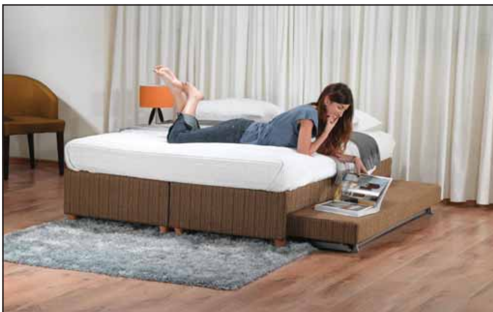
"עמינח" מציגה את Baruna

בקלות ועולה לגובה המיטה הקיימת על ידי מנגנון "קל-על" של "עמינח". המיטה נוחה מאד לשינה, ועם צירופה למיטת הבסיס היא הופכת למיטה זוגית לכל דבר.