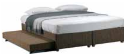
מחלקת פתרונות אירוח