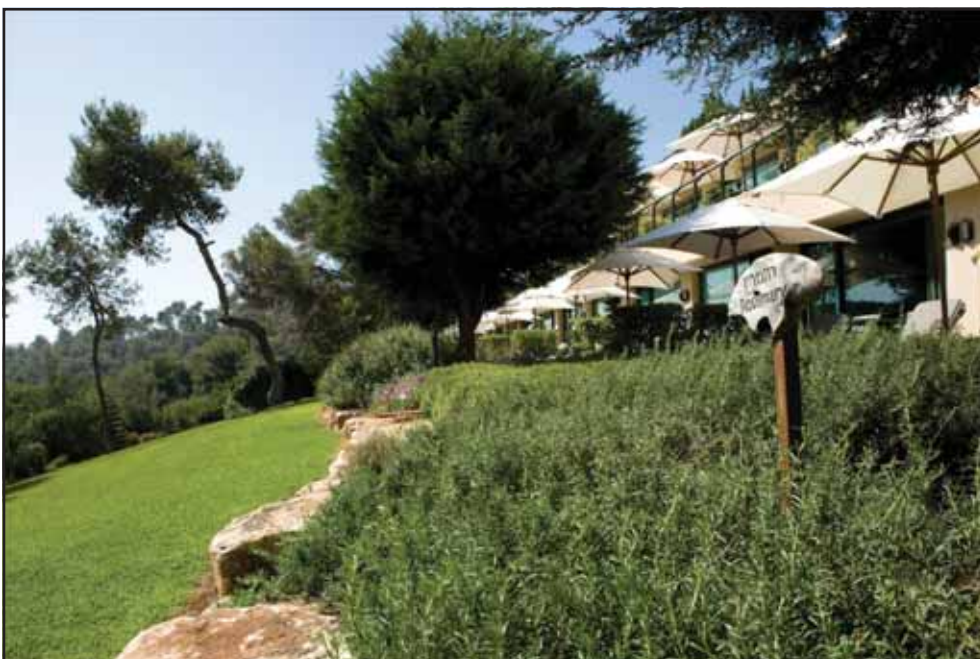
יערות הכרמל

גדר חדשה, טופלה צנרת החשמל והמים, הוחלפו מערכות של מיזוג אוויר, פנים האחוזה - חדרים ושטחים ציבוריים - נצבע ומסעדת האחוזה עוצבה מחדש. בנוסף, הושקעו 2 מיליון שקל בבניית בר יין חדש שיפתח במרץ