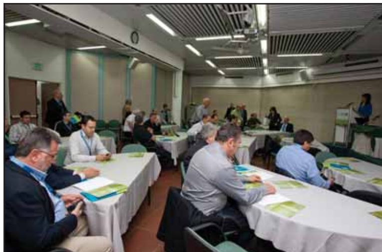
יום עיון בנושא גז טבעי.

הגז הטבעי נכנס לשימוש בארץ לפני מספר שנים ושימוש בעיקר צרכנים גדולים כמו חברת החשמל, מפעלי ים המלח ומפעלי תעשייה אחרים. בשנים האחרונות מתפתחת בארץ תשתית גז טבעי בלחץ נמוך, אשר תהפוך את הגז הטבעי לנגיש גם עבור צרכנים קטנים יותר, מפעלי תעשייה ועוד. כך, יהפוך הגז הטבעי למקור אנרגיה זמין גם למלונות. רשות הגז הטבעי במשרד התשתיות הלאומיות והתאחדות המלונות בישראל ערכו