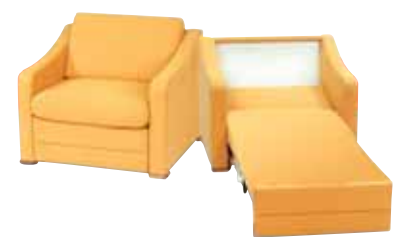
מחלקת ספות נפתחות

בין לקוחותינו: רשת מלונות ישרוטל • רשת מלונות פתאל • לאונרדו בוטיק, לאונרדו פלזה, לאונרדו אין, לאונרדו קלאב, מרידיאן • רשת מלונות דן • רשת מלונות אפריקה ישראל - הולדיי אין • רשת מלונות רימונים • רשת קלאב הוטל • רשת מלונות קיסר • רשת אטלס • רשת מלונות פרימה • רשת מריוט • רשת מלונות אילת אין • רשת זיבוטל, רשת שלום פלאזה, דיוויד אינטר קונטיננטל • הילטון - ת"א, אילת • דניאל - הרצליה, ים המלח • לוט, הוד, רויאל ים המלח • כנען ספא • רנסנס - ירושלים, ת"א • קרלטון - נהריה, ת"א • מלון חוף גיא • קלאב הוטל לוטרקי יוון • זארה, פורום, גלרט, מרידיאן, אנדרשי, הונור - בודפשט • ורלן - פריז • מוקסה, בוקרשטי, אופרה, נציה, סנטרל - רומניה • ויטקוב, טוליפ אין - צ'כיה • טרמינוס, קוונטין - הולנד • מאות בתי הארחה אכסניות נוער וצימרים בקיבוצים ברחבי הארץ