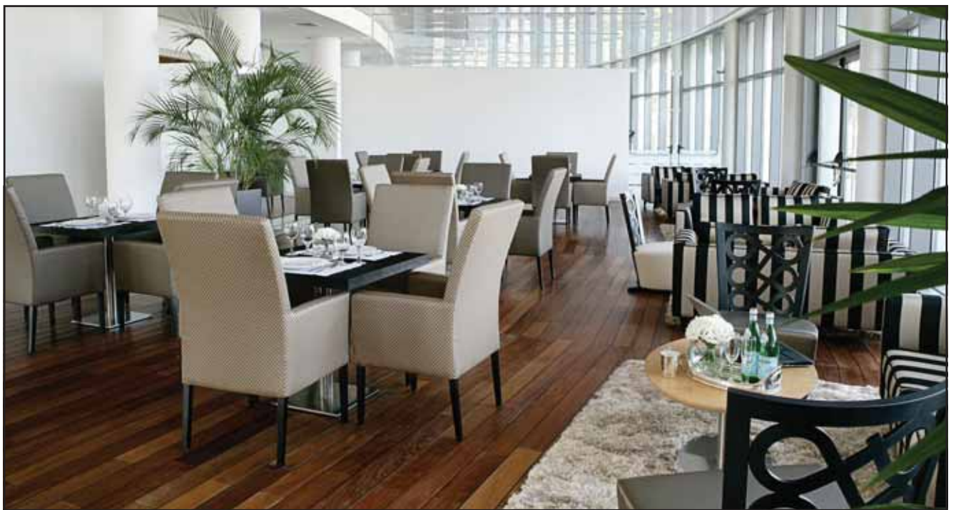
מסעדת West Cafe במלון West

מלון הבוטיק "בראון" בתל אביב משיק הצעה לזוגות רומנטיים: חבילת לינה, ספא לרגל יום ולנטיין. החבילה כוללת לינה בחדר קלסיק מעוצב, עיסוי זוגי בסוויטת הספא, בקבוק קאוור או יין עם פרלינים וארוחת בוקר רומנטית.