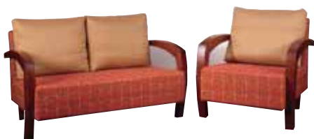
מחלקת פתרונות ישיבה

אתם מוזמנים להצטרף לבתי המלון והצימרים המובילים בארץ ובעולם, ולהעניק לאורחים שלכם שינה של 5 כוכבים. אצלנו תמצאו פתרונות כוללים לחדרי השינה וללובי: מגוון מזרני בריאות, מיטות מתכווננות ומערכות ריהוט עם המרכז הבריאותי של עמינח.